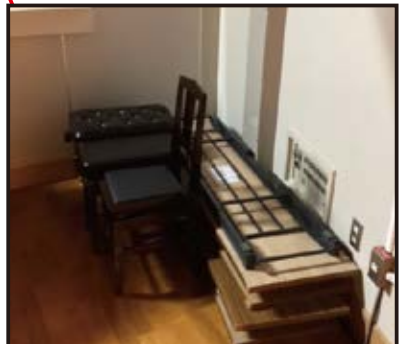
【ステージ上手】ピアノ椅子 長机