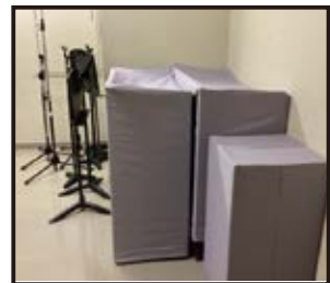
【通路】 演台(大・小) 花台 マイクスタンド 楽譜台