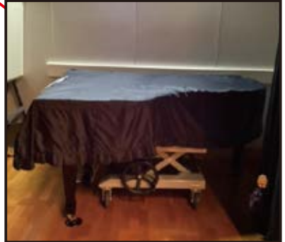
【ステージ上手】ピアノ

グランドピアノ・長机14・椅子48・譜面台2・ホワイトボード1・吊り看板・姿見鏡大5・姿見鏡小3 他 ワイヤレスマイク4・有線マイク2・HDMIケーブル・音響(CD、DVD、MD、カセット、外部入力)