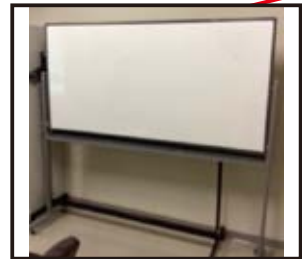
【控室】 ホワイトボード

※ 利用初回時は使用備品の打ち合わせが必要となります。 ※ 稼働椅子ご利用の場合は、前後30分(合計1時間)程度お時間を頂戴します。