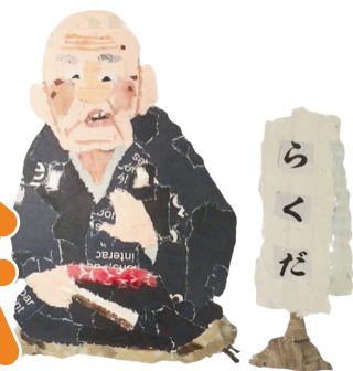
講師作【5代目志ん生】