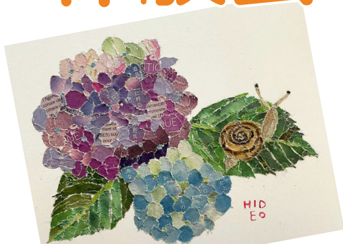
講師作【あじさいとかたつむり】※体験会では少し簡単にします。

気軽にはじめられるのに奥深く、 味わい深い作品が作れるのが魅力です。 指先を使うので脳活にも！