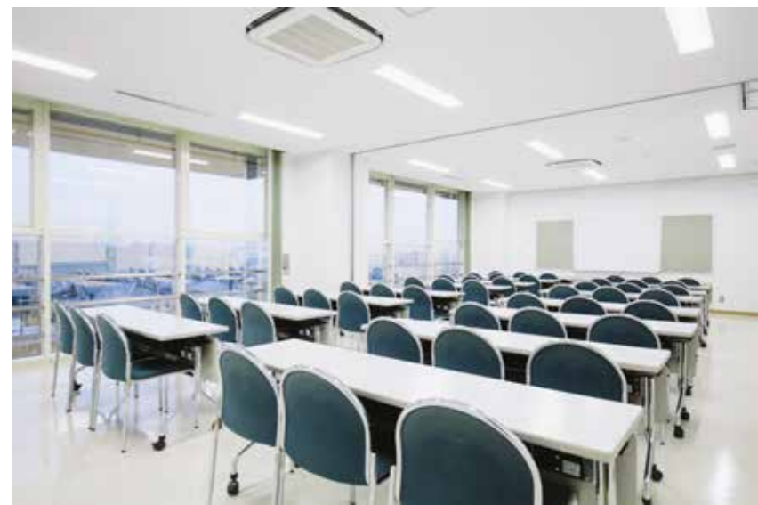
↑ 講習室 2・3 連結時